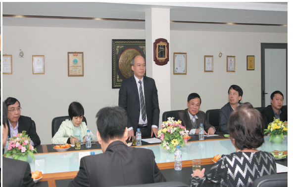
Thứ trưởng Vũ Văn Tám đánh giá cao những thành tựu của Fivevet trong 10 năm xây dựng và trưởng thành