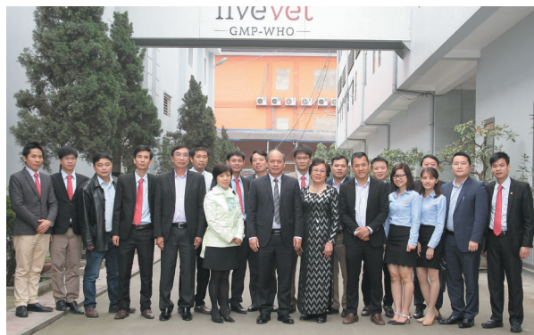
Đoàn làm việc của Bộ NN&PTNT chụp ảnh lưu niệm tại Fivevet