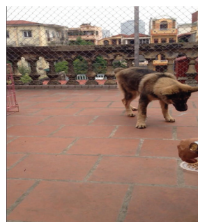
Hình 1. Bệnh súc đang được châm cứu 4 chân