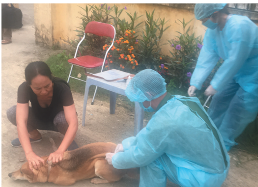
Thú y viên tiêm phòng vaccin dại cho chó tại cơ sở

Nếu các giải pháp trên được các cấp, các ngành triển khai đồng bộ, chắc chắn việc xây dựng Vùng an toàn bệnh dại tại các quận sẽ hoàn thành vào năm 2021 theo chỉ đạo của Thành phố./.